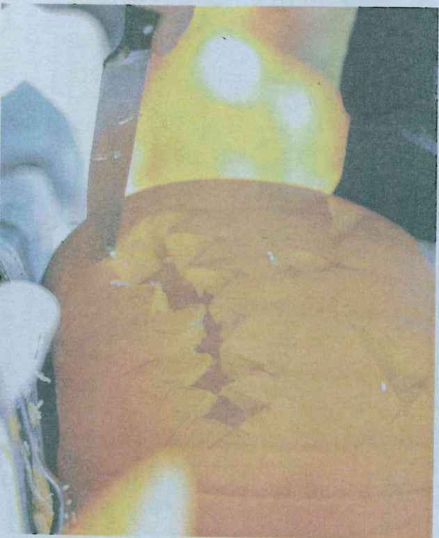
Kürbisschnitzen steht auch auf dem Stundenplan der Awo-Familienbildung. Anmeldungen werden noch entgegen genommen.